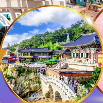
วัดแสงยงกุงซา