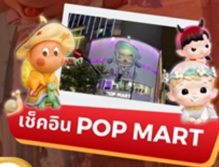
เชคอิน POP MART