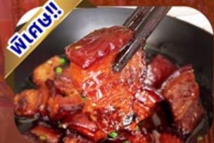
เมนูหมูสามชั้นตุ๋นน้ำแดง

พักโรงแรม 4 ดาว ★★★★★ ฟรี ประกันอุบัติเหตุ บริการ อาหารท้องถิ่น