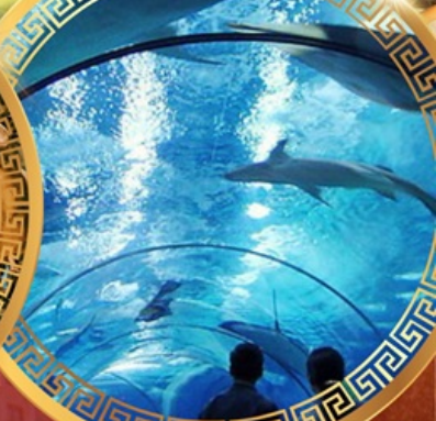
เซี่ยงไฮ้ไอเซียนอะควาเรียม