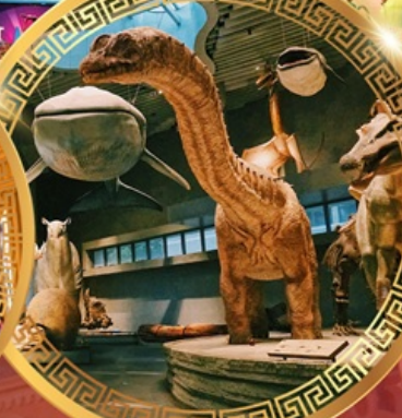
พิพิธภัณฑ์ธรรมชาติเซี่ยงไฮ้