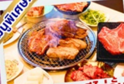
ปิ้งย่างเกาหลีไม่อื่น