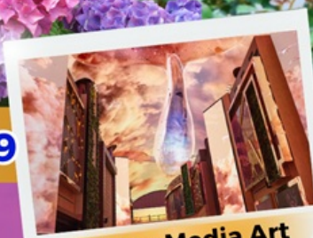
Aurora Media Art