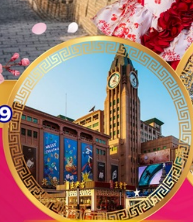
ถนนคนเดินหวังฝูจิ่ง

เที่ยวย่านการค้าดังกลางกรุงปักกิ่ง ถนนคนเดินหวังฝูจิ่ง จัตุรัสเทียนอันเหมิน พระราชวังกุ๊กกิง หอฟ้าเทียนถาน ช้อปปิ้งย่านซานหลี่ถุน พระราชวังฤดูร้อนอวิ๋เหอหยวน กำแพงเมืองจีนด่านอวิ๋หยงกวน ชมซากุระบาน สักการะวัดลามะ