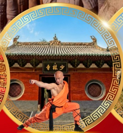
วัดเล่าหลิน