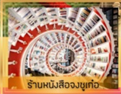
ร้านหนึ่งสี่องซูเก๋