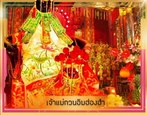
เจ้าแม่กวนอิมฮ่องซ่า