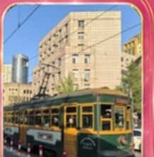
ขั้วรถรางไฟฟ้าชมเมือง