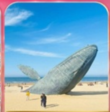
ประติมากรรม "วาฬผู้โดดเดี่ยว"