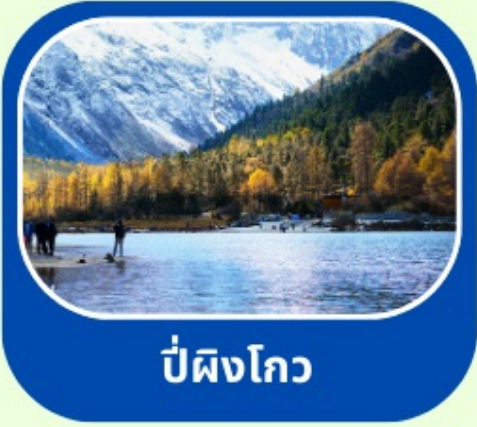
ป่าผิงโกว