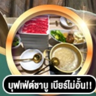
บุฟเฟ่ต์ชาบู เภียรไม่อั้น!!