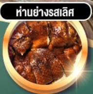
हांอย่างรสเลิศ