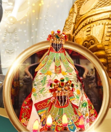
เยี่ยมเงินเจ้าแม่กวนอิมสองฮา