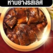
ทำนอย่างรสเลิศ