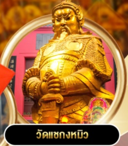
วัดเซกขงหมิว