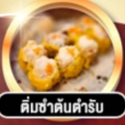
ต้มซ่าคั้นตำรับ