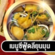
เมนูซีฟู้ดลิ้นจี่