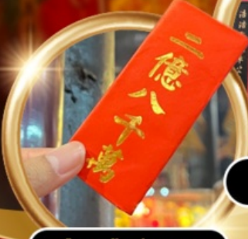
ยืมเงินเจ้าแม่กวนอิม