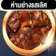
हांอย่างสเลิศ