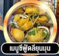
เมนูซีฟู้ดลีสุมบุน