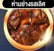
हांอย่างสลิส