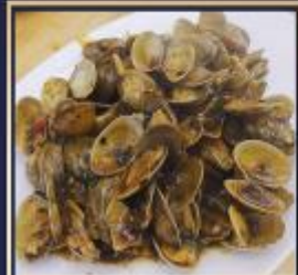
ผัดหอยลาย