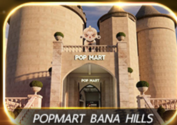
POP MART BANA HILLS

สัมผัสความงามหมู่บ้านฝรั่งเศสที่บานาฮิลล์ ซอปปิง POPMART