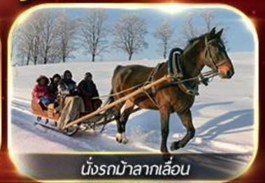
นั่งรถม้าลากเลื่อน

ฟรีนั่งรถม้าลากเลื่อน ชมโชว์ว่ายน้ำน้ำแข็ง แม่น้ำชองหวาเจียง