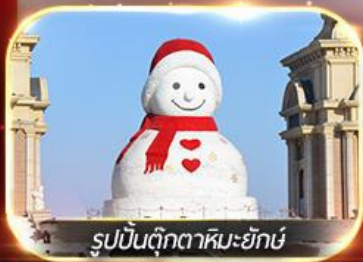
รูปปั้นตุ๊กตาหิมะยักษ์