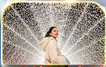
ชมงานประดับไฟนาบามา โนะ ซาโตะ