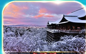
วัดคิโยมิตสึ