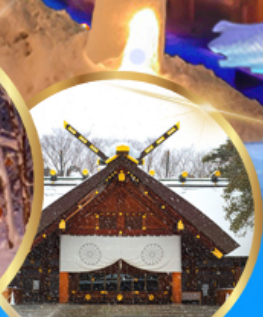
ศาลเจ้า ออกโทโต

เดินทาง 04 - 09 กุมภาพันธ์ 68 05 - 10 กุมภาพันธ์ 68 06 - 11 กุมภาพันธ์ 68