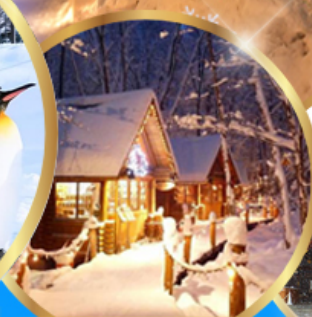
หมู่บ้านเทพนิยาย นิงเกิลทอเรส