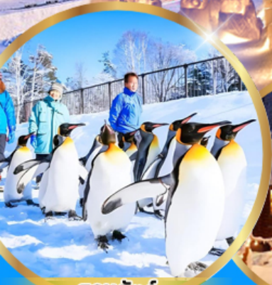
สวนสัตว์ อาซาฮิยาม่า