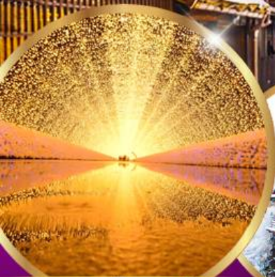
นาบาระ โนะ ซาโตะ