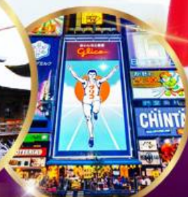
ช้อปปิ้ง ซินโซบาชิ