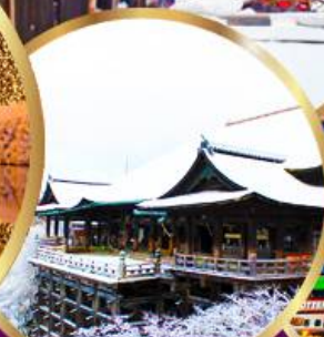
วัด คิโยมิตสึ