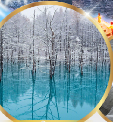
บ่อน้ำสีฟ้า