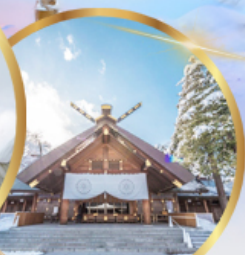
ศาลเจ้าฮอกไกโด