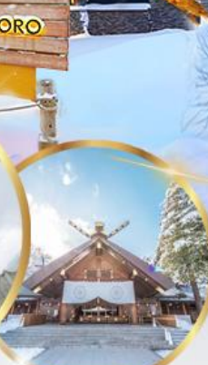
ศาลเจ้าฮอกไกโด