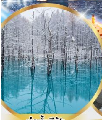
บ่อน้ำสีฟ้า