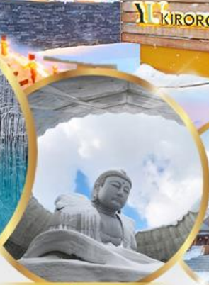
เป็นเขาแห่งพระพุทธเจ้า