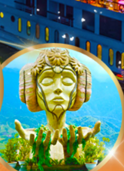
โมนาน่า คาเฟ่