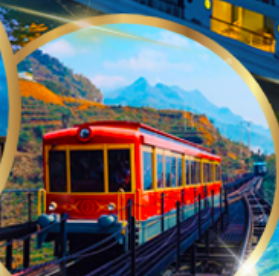
รถราง ซาปา