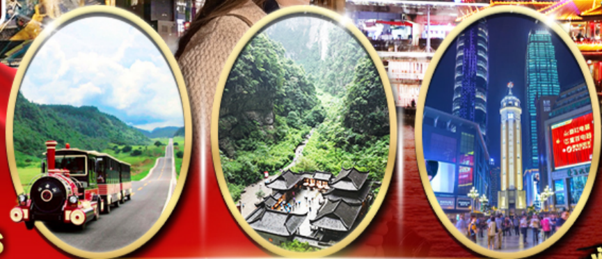
อุทยานเขานางฟ้า อุทยานหลุมฟ้า สะพานสวรรค์ ถนนคนเดินเจียฟางเป่ย์