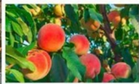
เก็บลูกพีชสด ๆ จากต้น