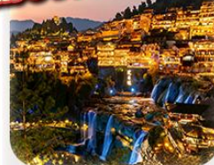
“เมืองโบราณฟู่หลงเจิ้น”