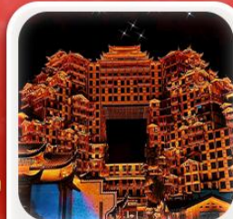
“ตึกมหัศจรรย์ 72 ชั้น”