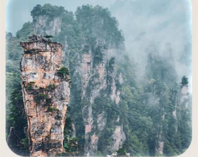
“หุบเขาอวตาร”