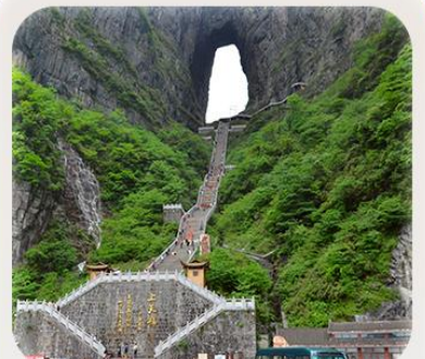
“กำประตูลิ่ว”