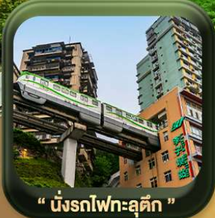
“ นังรถไฟทะลุตึก ”

บินตรงลงฉงชิ่ง • อุ่หลง หลุมฟ้าสะพานสวรรค์ • ระเบิดยงแกว • อุทยานเขานางฟ้า หงหยาดัง • นังรถไฟทะลุตึก • ศาลาประชาม (ด้านนอก) • หลงหมินฮ่าว มรดกโลกผาหินแกะสลักต้าจู้ • วัดหลิวอัน • ตึกตะเกียบ • ถนนคนเดินเจียฟางเปย์