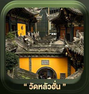
“ วัดหลิวอัน ”