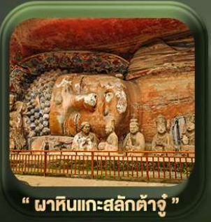
“ ผาหินแกะสลักต้าจู้ ”

วันเดินทาง มี.ค. - ต.ค. 2569 ราคาเริ่มต้น 22,999.-