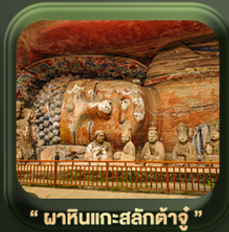
“ ผาหินแกะสลักต้าจู้ ”

วันเดินทาง มี.ค. - ต.ค. 2569 ราคาเริ่มต้น 22,999.-