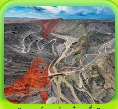
"แกรนด์แคนยอนคู่ชาวจื่อ"

ซินเจียงเหนือ ทะเลสาบโซลิมู่ "น้ำตาหยดสุดท้ายของแอตแลนติก" • กุ้งหน้านาราตี กุ้งดอกไม้เทียนซาน • ผ่านชมสะพานกั๋วจื่อโกว • ถนนหลิวซิงเจียง • ตลาดต้าปาจา