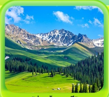
"กุ้งหน้านาราตี"