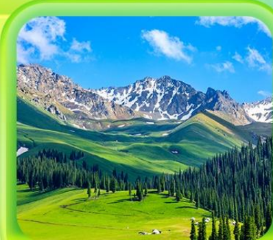
"กุ่มหญ้านาราที"