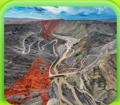
"แกรนด์แคนยอนคู่ชานจื่อ"

ซินเจียงเหนือ ทะเลสาบไซลีมู่ "น้ำตาหยดสุดท้ายของแอตแลนติก" • กุ่มหญ้านาราที กุ่มดอกไม้เทียนซาน • ผ่านชมสะพานกั๋วจื่อโกว • ถนนหลิวซิงเจียง • ตลาดต้าปาจา