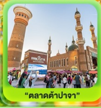
"ตลาดต้าปาจา"

รวมรถไฟความเร็วสูง 1 ขบวน (อ๋เหมิง - อูรูมูฉี)