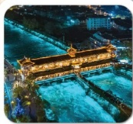
"สะพานหนานเจียว"