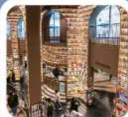
"ห้องสมุดจงซูเก๋"