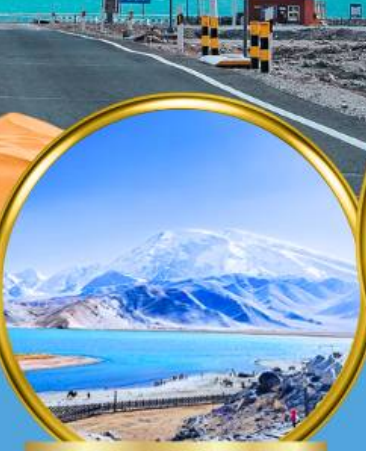
Kala Kule Lake