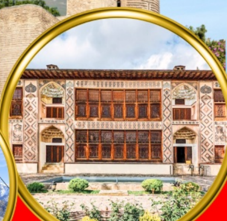
Palace of Shaki Khans