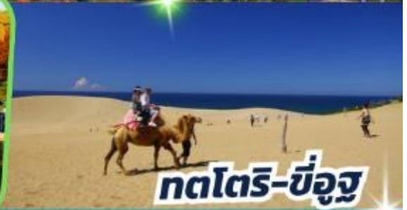
ทตโตริ-ซ็องสุ