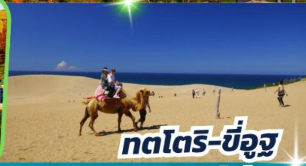
ทตโตริ-ซ็องจู