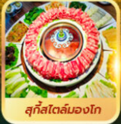
สุกีสโตล์มองโก