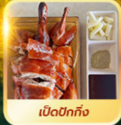
เปิดปอกกิ้ง