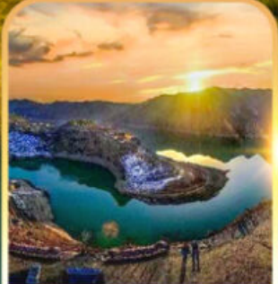
หุบเขาแม่น้ำอวองเหอ