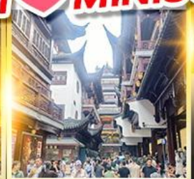
เจียงหวงเมี่ยว