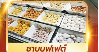
ชาบูบุฟเฟ่ต์