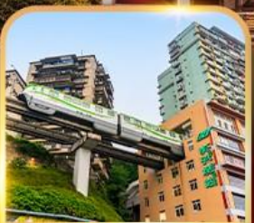
รถไฟฟ้าลัดติง