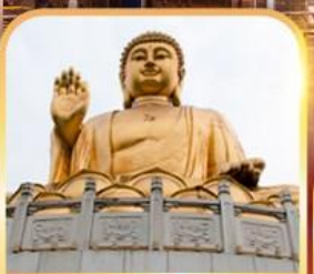
วัดหัวเหยียน