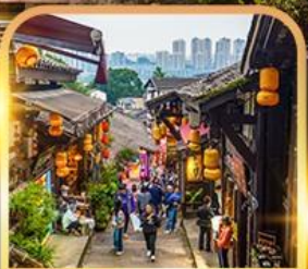
หมู่บ้านโบราณฉือซีโซ่ว