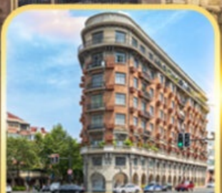
อาคารอู๋คัง