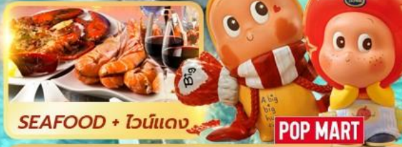
SEAFOOD + ไวน์แดง