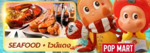
SEAFOOD + ไวน์แดง