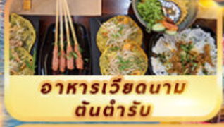
อาหารเวียดนาม ต้นตำรับ