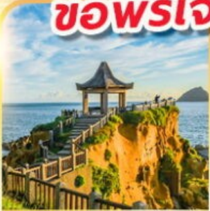
เกาะเหอผิง

พักย่านซีเหมินติง 2 คืน ขอพรเจ้าแม่กวนอิมพันมือ