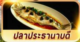
ปลาประรานาบดี