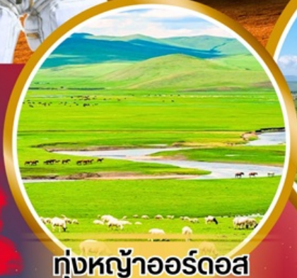
ทุ่งหญ้าออร์โดส

พิเศษ!!! สวมชุดของโกเลีย บนกระโหลกของโกเลีย