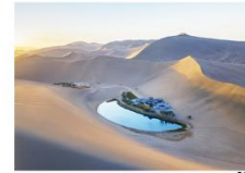
ทะเลทรายหมิงซาซาน ทะเลสาบพระจันทร์เสี้ยว

16.32 น. ออกเดินทางสู่เมืองอู๋หลู่ฟาน ด้วยรถไฟความเร็วสูง ขบวนที่ D55