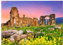
เมืองโบราณโรมันไวลูบิลิส