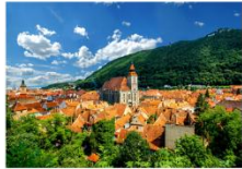
เมืองบราซอฟ