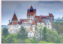
ปราสาทแดร์ริคูล่า

** พักที่ Ramada by Wyndham Sibiu Hotel 4* หรือเทียบเท่า **