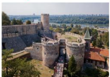
ป้อมปราการเมลเกรต ถนน Knez Mihailova

** พักที่ Abba Hotel 4* หรือเทียบเท่า **