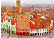
เมืองซีบิว