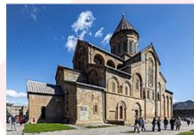
วิหารสเวตสโคเวลี