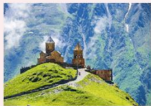
Gergeti sameba church

** พักที่ Intourist Kazbegi Hotel หรือเทียบเท่า **