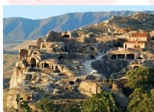
เมืองอพลิสซิค