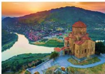
อารามจวารี