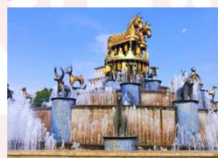
เมืองคูไทซี

** พักที่ Kutaisi Inn Hotel หรือเทียบเท่า **