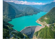
เซ็อนเอนกูรี