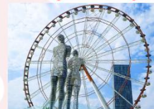
รูปปั้นอาลีและนีโน