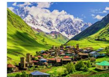
หมู่บ้าน Ushguli

** พักที่ Best Western Hotel หรือเทียบเท่า **