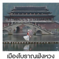
เมืองโบราณฟังหวง