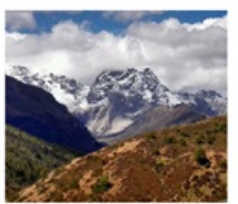
ภูเขาหิมะเหมยลี่

สวนน้ำตก / อุทยานผู้ต่าซิว (รถแบตเตอรี) / เมืองโบราณแชงกรีล่า วัดลามะชงจ้านหลิง / โค้งแรกแม่น้ำจินซาเจียง / ภูเขาหิมะไป๋หม่าง วัดเฟยโหล / ชมภูเขาหิมะเหมยลี่ / วัดตงจู่หลิน อุทยานยาดิง (รวมรถอุทยาน + รถแบตเตอรี) / กุ้งหญาลิ้วทรง ทะเลสาบน้ำนม / ทะเลสาบห้าสี / วัดชงกู่ / ทะเลสาบไข่มุก ถนนคนเดินจินปี้ลู่ / ตำนั๊กทอง