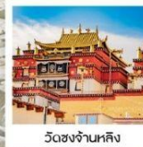
วัดชงจ้านหลิง