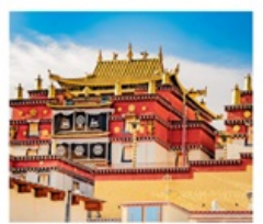
วัดชงจ้านหลิง

คุณหมิง • ยาดิง • เต๋อซิง • แชงกรีล่า 8 DAYS 7 NIGHTS