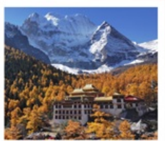
วัดชงกู่