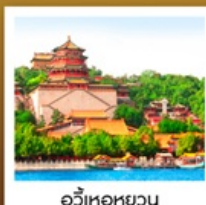
อวิ๋เหอหยวน

ลิ้มรสเมนูพิเศษ เปิดปักกิ่ง / สุกี่มองโกล มิซซอลิน TAO TAO JU