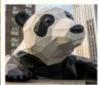
ห้าง IFS แพนด้าปิ่นตึก