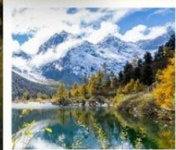
ปี้เผิงโกว