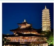
เมืองโบราณผู้หยวน

เมืองโบราณผู้หยวน / ภูเขาหินัวส่วซาน (รวมรถกอล์ฟ) ห้างสรรพสินค้าเต๋อจี / วัดจื๋อหมิง / ทะเลสาบเซวียนอู่ ถนนอู่กงต้าเต้า / อู๋ซีหมู่บ้านเหียนฮวาวาน / เขาหูซิว เชียงใหม่ คลาสสิก ไนท์ / ถนนนานกิง / Tian An 1,000 Trees North Bund Green Land / Florentia Village Outlet