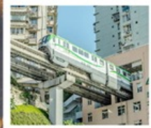
รถไฟฟ้าคุตัก