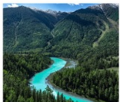
อุทยานคานาสือ

สวนม้าป่าโบราณ / ทางด่วนทะเลทราย S21 เขตภูมิศาสตร์ยาร์ดัง / เขตปีศาจทะเล (รวมล่องเรือ) / ไซโป้ชา ทุ่งหญ้าอาเหอถังโก่เกี / หมู่บ้านเหมอมู่ซุน (รวมรถอุทยาน) / จุดชมวิวฮาดิง ล่องเรือทะเลสาบคานาสือ / จุดชมวิวกานาสือศาลาชมปลา / ทะเลสาบวงพระจันทร์ ทะเลสาบมังกรหลับ / ทะเลสาบกุวตา / ธารน้ำ 5 สี / เมืองปีศาจ (รวมรถไฟเล็ก) แกรนด์แคนยอนตู้ซานจื่อ / ตลาดต้าปาจา