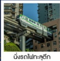
นั่งรถไฟทะลุติ๊ก